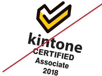
構成要素のバランスを変える