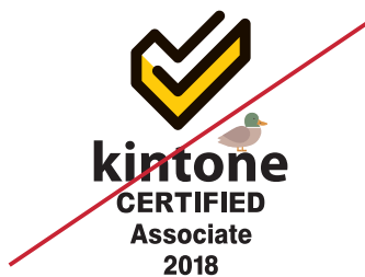
他の要素を加える