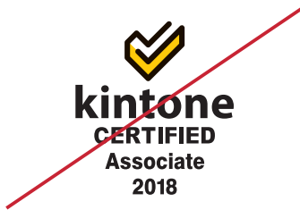
構成要素のサイズを変える