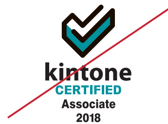
指定色以外を使う