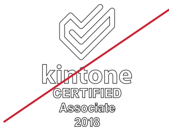
アウトライン表示する