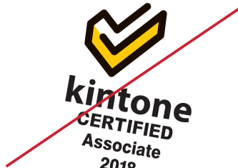
構成要素のバランスを変える