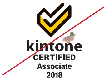
他の要素を加える