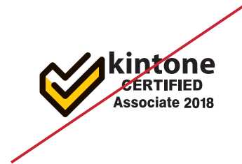
構成要素の位置を変える