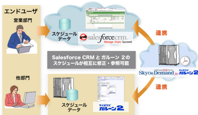
図1. Salesforce CRM とサイボウズ ガルーン 2 との全体連携イメージ

営業マネージャーや他の担当者が「ガルーン 2」でスケジュール変更を行った場合、営業担当者は変更後のスケジュールを「Salesforce CRM」上で参照が可能です。