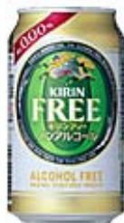
キリンフリー商品開発 チーム(キリンビール)