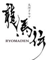
大河ドラマ 龍馬伝 制作チーム(NHK)