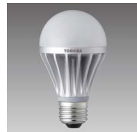
LED 電球商品開発チーム (東芝ライテック)

各チームが商品・作品を作り上げるまでの様々な困難の中も、モチベーションを落とさぬよう、各リーダーが心がけたことや、制作・開発秘話などをご紹介します。