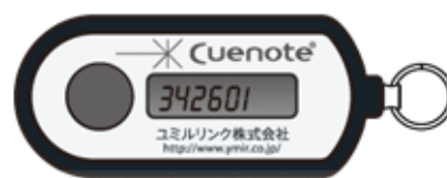
<デバイス(セキュリティトークン)>

ユミルリンクは、OTP の導入を通して、企業が安心して ASP・SaaS サービスをご利用いただける環境の整備に努めることで、メール配信市場の成長に貢献してまいります。