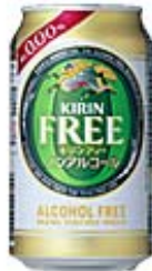
キリンフリー商品開発 チーム(キリンビール)