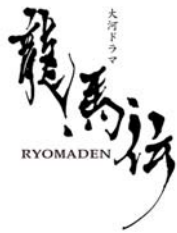
大河ドラマ 龍馬伝 制作チーム(NHK)