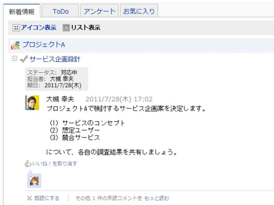
【ホーム画面の新着情報】

ホーム画面のユーザーインターフェースを刷新しました。複数の未読コメントを画面遷移なしで閲覧できるほか、投稿に「いいね！」を付けることも可能になりました。これにより、複数の新着情報を効率的に確認できます。また「ToDo」「アンケート」「お気に入り」をタブの切り替えで確認できるようになりました。