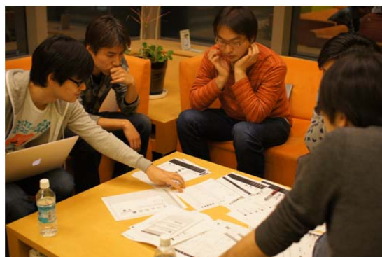
ペーパープロトタイプによる検証