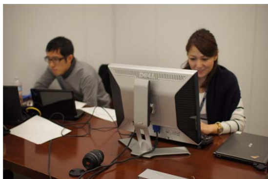
ユーザーテスト（左：進行役 右：被験者）

誰にでも・どこにいても扱えるほどに簡単に・安心して使える品質の IT システムが、買いや すい価格ですぐに手に入る、そんなファストシステムを作りたい。その想いを実現するため 「kintone」は、ユーザービリティテストや社内環境でのテスト運用の実施、およびお客様 のご要望を取り入れてリリースから 2 か月でファストにカイゼンしました。今後も、Web アプ リケーションの作成と同様に新たな機能の追加や改善、PC・モバイルでの利用シーンでも「フ アスト」な体験をご提供します。