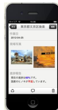
※開発途中のイメージ画面

iPhone から「kintone」で作成した日報・報告書・タスクリストなどにアクセスすることで、現場を飛び回る担当者とオフィスのスタッフや上司との情報共有をスムーズに促し、クラウド×スマートフォンのビジネス利用の幅を個人からチームへと大きく広げます。