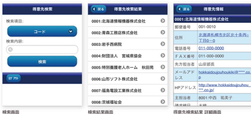
サイボウズリモートサービスの認定製品として追加された「販売大臣 NX スマートフォンユニット」のサンプル画像