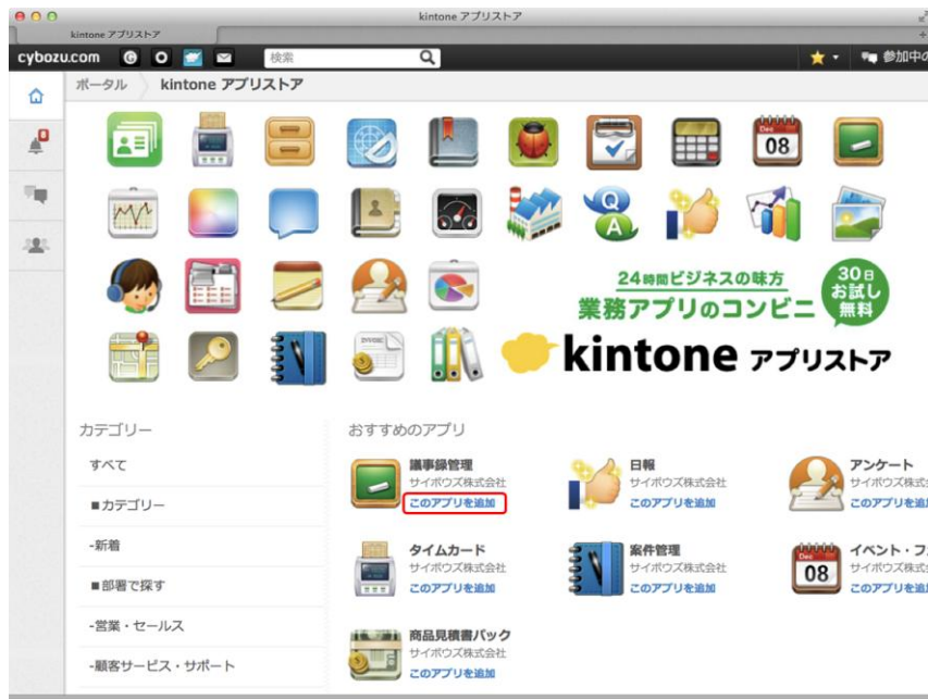
(図5) 「このアプリを追加」の1クリックでアプリが追加可能に

アプリを追加するまでの作業を大幅に減らし、わずか1クリックで追加可能です。業務に使えるようなアプリがあったときに、ますますお試ししやすくなりました。(図5)