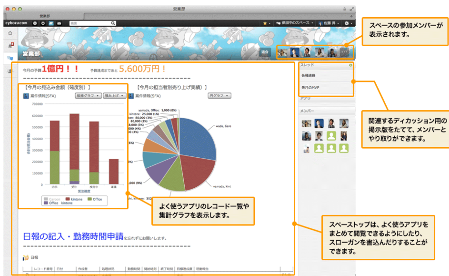
(図6) 「スペース」はメンバー内でデータを共有し議論できる (図は営業部スペース)

さらに、ディスカッションに必要なデータが蓄積された kintone アプリをスペース内に簡単に表示できるので、データを見ながらディスカッションをするなど、業務効率を飛躍的に向上させる使い方が可能です。