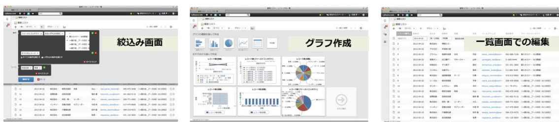
(図2) Excelの使いやすさそのままに、絞り込みやグラフ作成、一覧画面での編集ができる

1行のデータ毎に詳細画面があるため、顧客や案件詳細情報を見間違えることなく正確に閲覧・編集できることが特徴です。また、詳細画面にはコメント書き込みが可能で、従来は別途メールや口頭などでやり取りしたコミュニケーションをデータ情報と紐づけて管理できることも「kintone」ならではの使い勝手です。(図3)