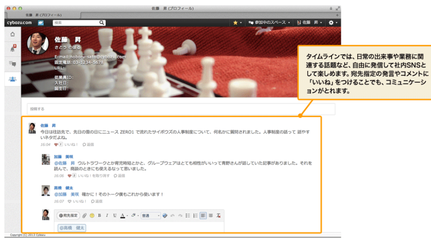
(図7) 社内 SNS を実現する「ピープル」機能

kintone の登録ユーザー1人1人が個人のタイムラインを持ち、自由に情報発信ができます。フォロー/アンフォロー、メンション、発言へのいいね! ボタンなど、一般的な SNS と同様の機能があり、社内ネットワークの交流を手助けします。(図7)