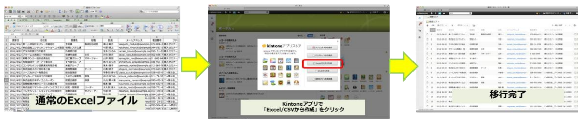
（図1）Excel 移行の手順はワンクリックで

新機能「Excel からのアプリ作成」では、アプリ作成画面で Excel ファイルを選択し、読み込むことで「kintone」が最適なフィールド設定を判断し、アプリケーションを自動的に作成します。Excel ファイルに登録されていたデータも同時に移行できます。（図1）