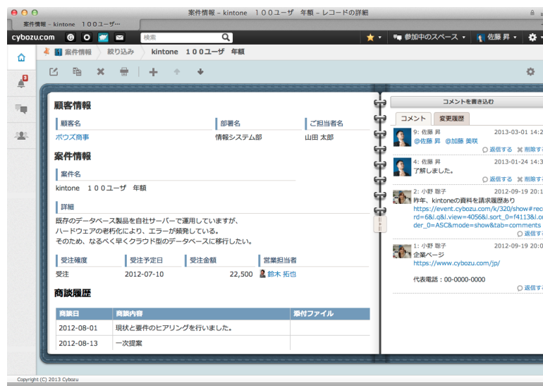
(図3) 各データの詳細画面：データ1つ1つにコメントによるコミュニケーションができる

1行のデータ毎に詳細画面があるため、顧客や案件詳細情報を見間違えることなく正確に閲覧・編集できることが特徴です。また、詳細画面にはコメント書き込みが可能で、従来は別途メールや口頭などでやり取りしたコミュニケーションをデータ情報と紐づけて管理できることも「kintone」ならではの使い勝手です。(図3)