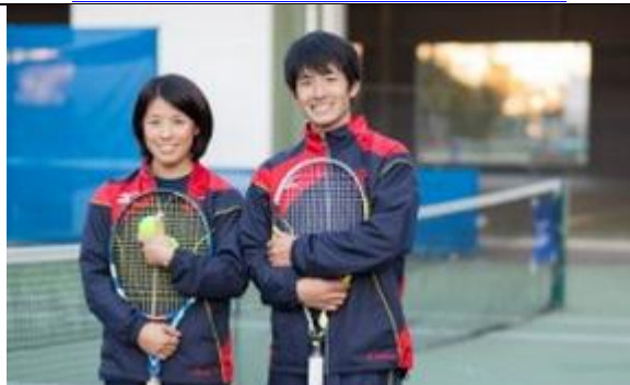
慶應チャレンジャー国際テニストーナメント 様 プロテニスツアーの国際大会を運営する大学テニス部 https://live.cybozu.co.jp/casestudy.html?q=2003