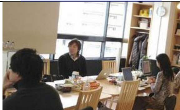
JUSO Coworking 様