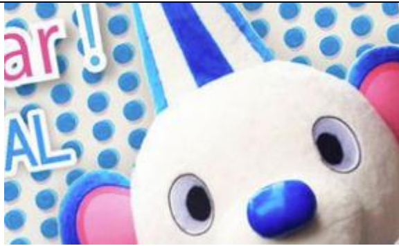
ユニバーサル・サウンドデザイン 様 耳が不自由な人が暮らしやすい環境を作る NPO 法人 https://live.cybozu.co.jp/casestudy.html?q=156