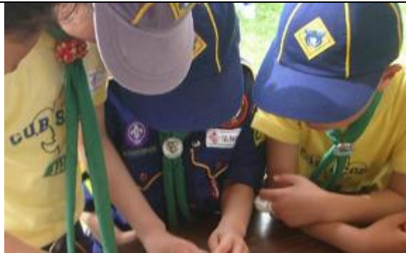
ボーイスカウト埼玉県連盟 様 社会奉仕活動を通じて青少年のチームワークを育てる団体 https://live.cybozu.co.jp/casestudy.html?q=137