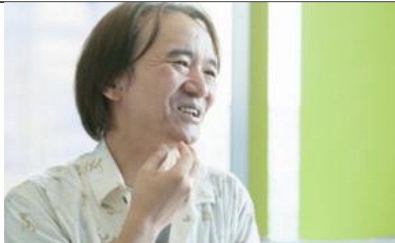
漫画家 すがやみつる 様 漫画家育成を行う大学ゼミ https://live.cybozu.co.jp/casestudy.html?q=1641