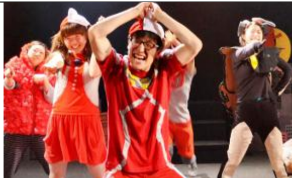
京都学生演劇祭 様 「学生劇団による演劇界の活性化」を目指す学生団体 https://live.cybozu.co.jp/casestudy.html?q=2222