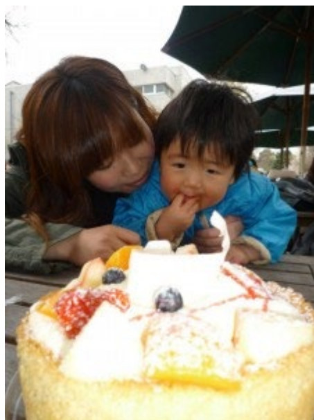
インターン学生による子育て支援